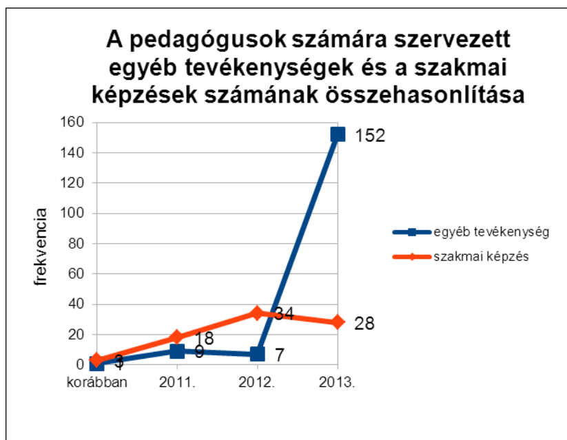
2. számú ábra – az egyéb tevékenységek és a továbbképzések összehasonlító táblázata

munkaformákkal és témákkal való jelentős mértékű bővülését mutatják, amelyek a pedagógusok, gyermekek és tanulók, valamint a szüleik számára szervezett már megkezdett, illetve még újabb tevékenységi formák megvalósítását, illetve bevezetését és lebonyolítását jelentik. (erről részletesen jelen beszámoló III. fejezetében).