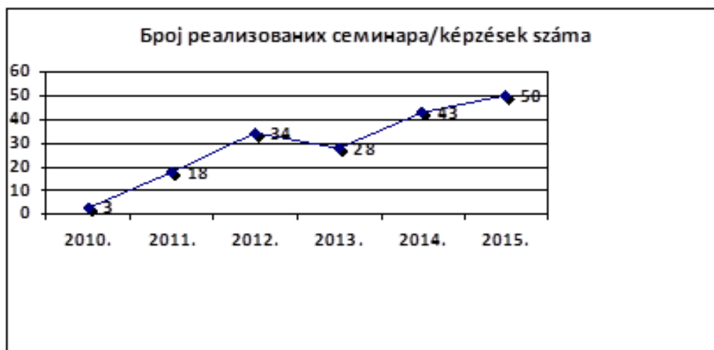
1. számú ábra – megvalósított képzések száma a 2010-2015. időszakban

A korábbi évekhez viszonyítva növekedett az intézményen kívül megtartott képzések száma 2015-ben. A Központ munkatársai 2015-ben Zentán, Temerinben, Nagybecskereken, Adán, Csókán, Tizsaszentmiklóson, Csantavéren, Szenttamáson, Ravno Seloban, Velika Župában, Belgrádban, Voždovacon, Újvidéken, Šabaccon, Čačakban stb. tartottak képzéseket.