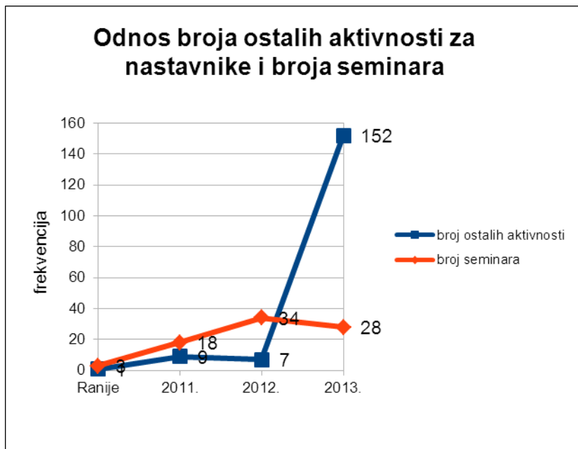
Графикон бр. 3 - компаративни приказ броја осталих активности за наставнике и броја семинара

У претходном графикону видимо бројчано опадање броја сати стручног усавршавања у односу на претходну годину. Овај податак се тумачи упоредним приказом броја сати осталих активности у 2013. години, које у односу на раније године показују значајан раст. Овакви показатељи резултат су проширивања опсега облика рада РЦ, настављању већ започетих и увођењу нових облика рада за наставно особље, децу и родитеље (деталније у III делу овог извештаја).