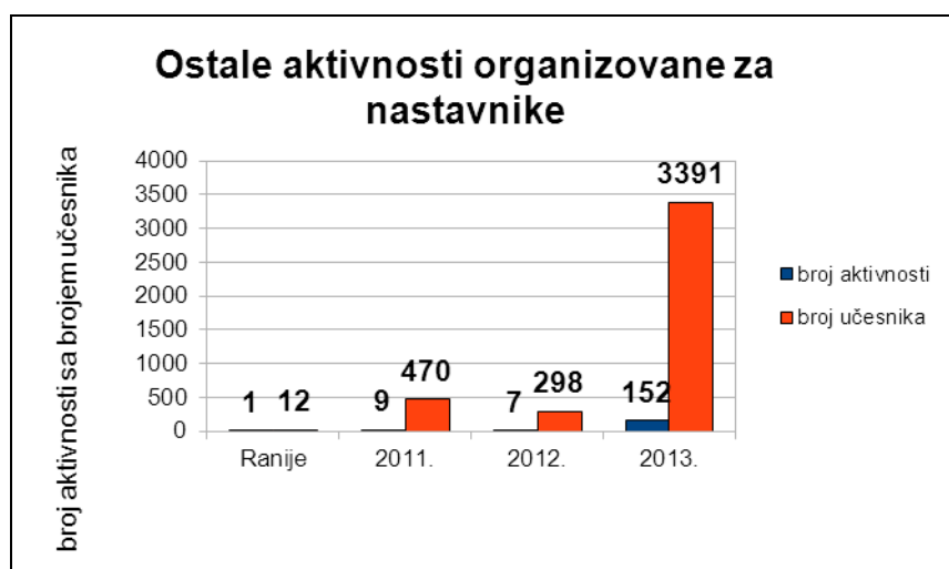
Графикон бр. 2 – компаративни приказ броја активности и броја учесника у протекле три године и у ранијем периоду

Графички прикази указују на значајан пораст броја активности и корисника наших услуга у 2013. години, подразумевајући ту пре свега директне актере васпитно-образовног рада (просветни радници, деца родитељи) као и ваннаставно особље.